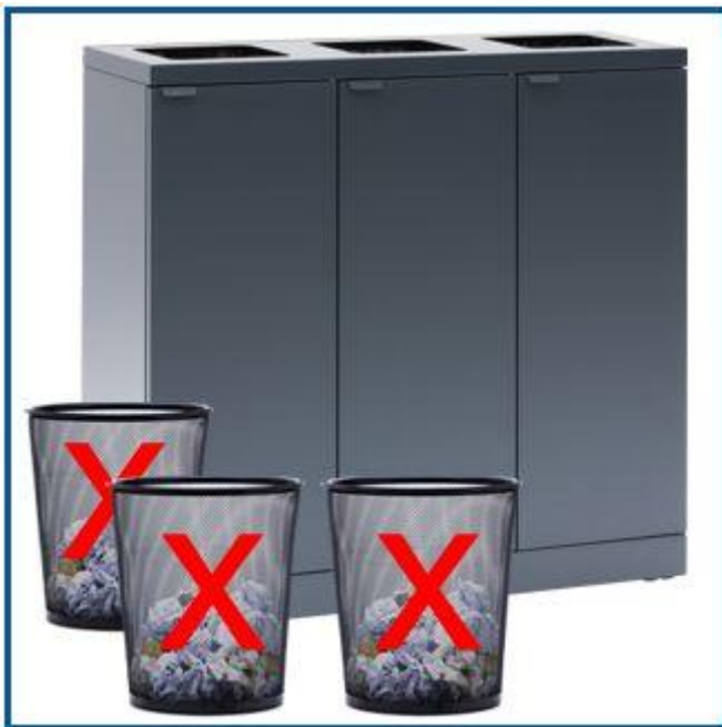
Udskift mange beholdere til bare én affaldsstation