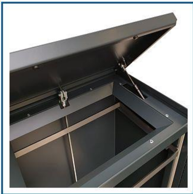
Den stærkeste håndfri beholder på markedet