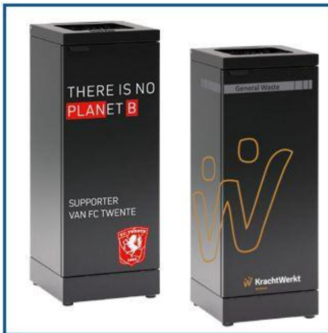
Rene overflader gør det nemt at lave decor