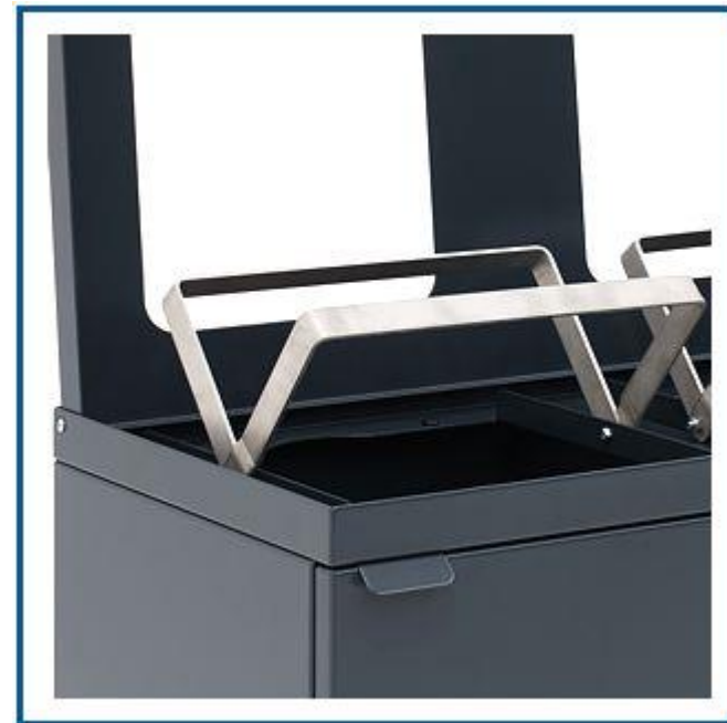
Stærk poseholder. Hurtigt skift. Poser glider ikke