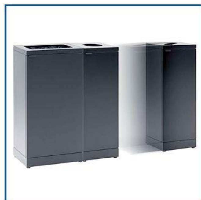
Tilføj uendeligt mange moduler efter behov