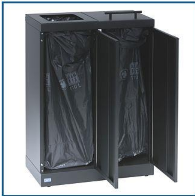
Ingen tunge løft. Tømmes via frontåbning