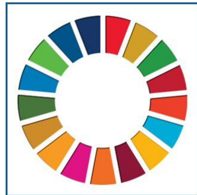
Verdensmål; en naturlig del af Bica®. Bl. a. ISO 14001

Bica® Det mest gennemtænkte kildesorteringsmøbel på markedet i dag. Bica® beholdere er også brandtestet, hvilket er endnu et eksempel på udvikling i samarbejde med kunder. En hotelkæde stillede simpelthen et krav om det og Bica var det eneste varemærke der, på det tidspunkt i 2021, kunne vise en DBI brandtest.