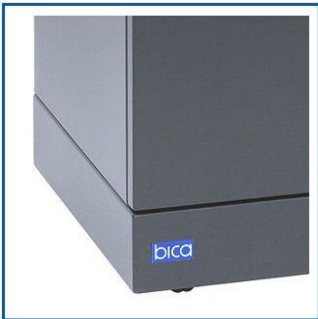
Ingen smudsfælder. Hjul og hængsler er skjulte